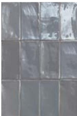
4100364 HOPS LUX Grigio 7,5x15 / 3"x6"