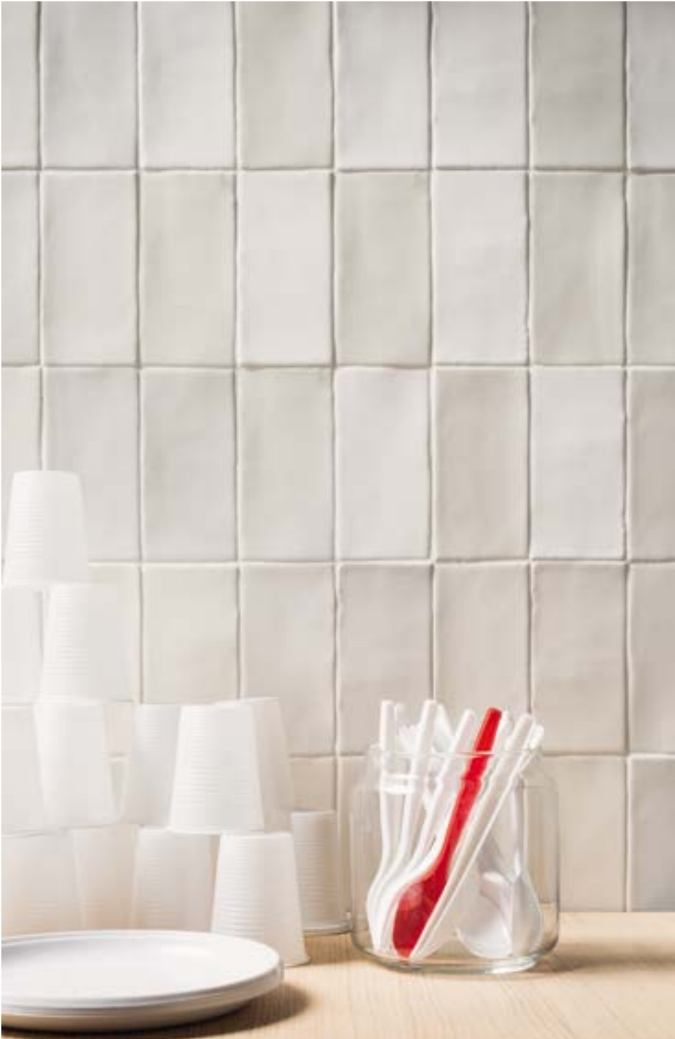
HOPS MATTE BIANCO