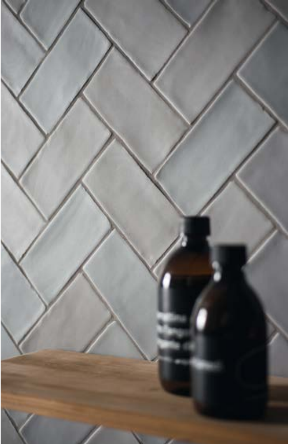
HOPS MATTE GRIGIO