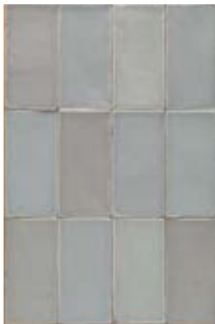
4100367 HOPS MATTE Grigio 7,5x15 / 3"x6"