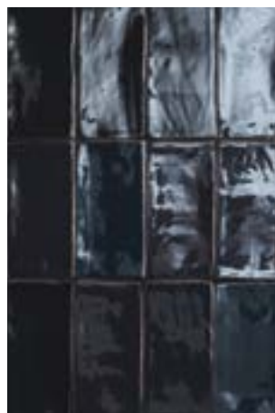
4100365 HOPS LUX Nero 7,5x15 / 3"x6"