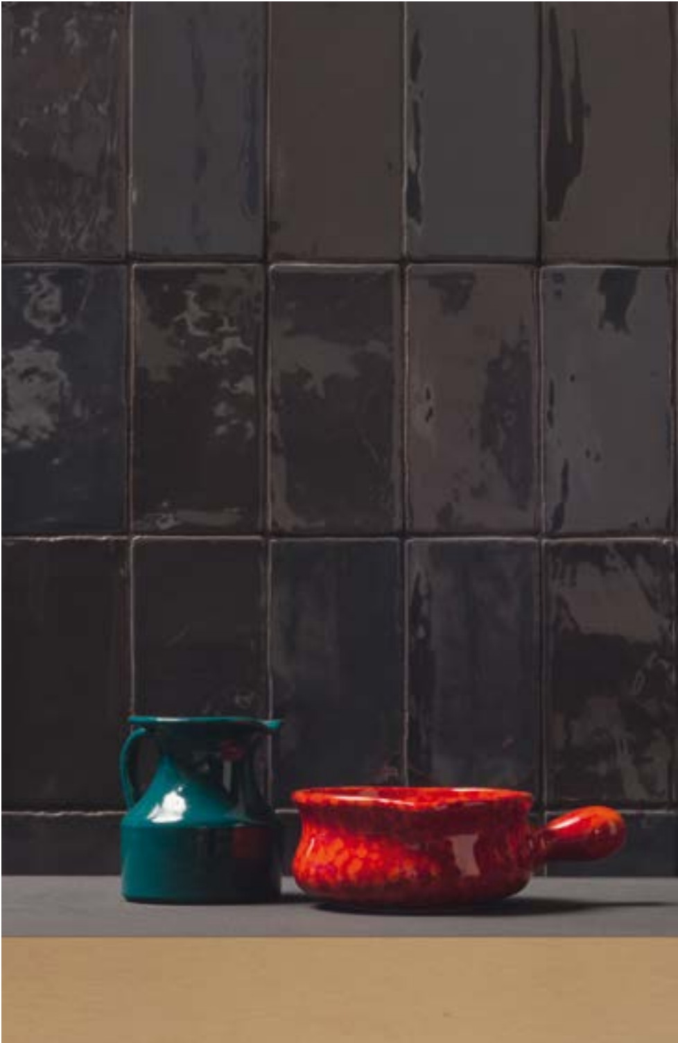
HOPS LUX NERO