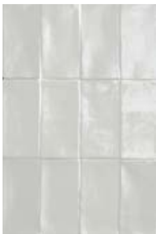
4100363 HOPS LUX Bianco 7,5x15 / 3"x6"