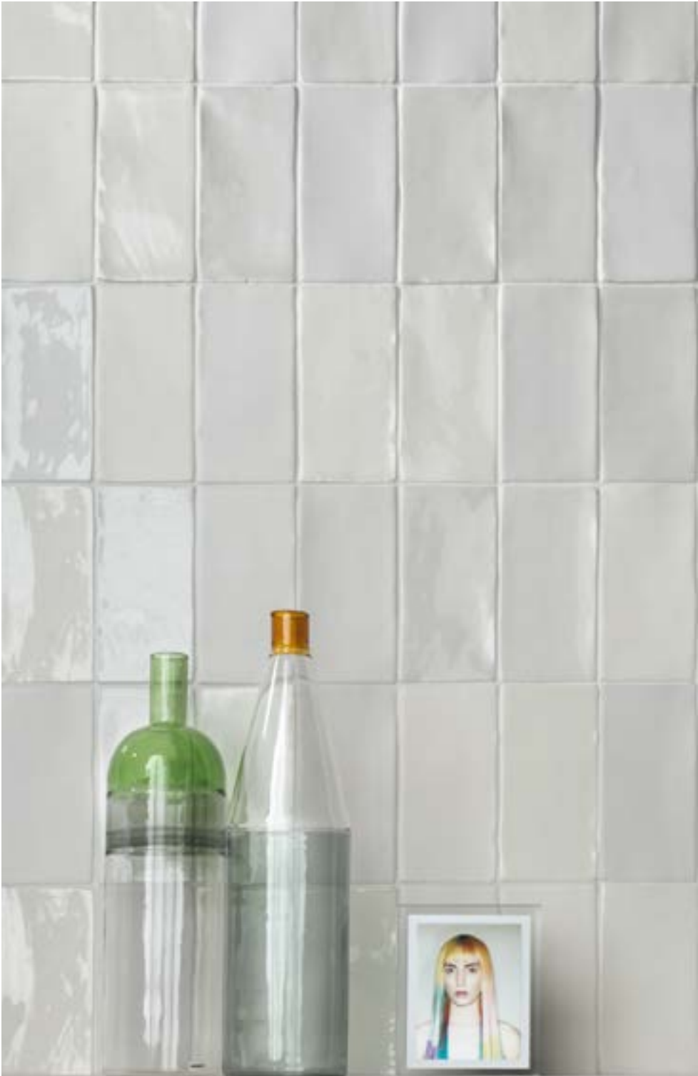
HOPS MATTE BIANCO + HOPS LUX BIANCO