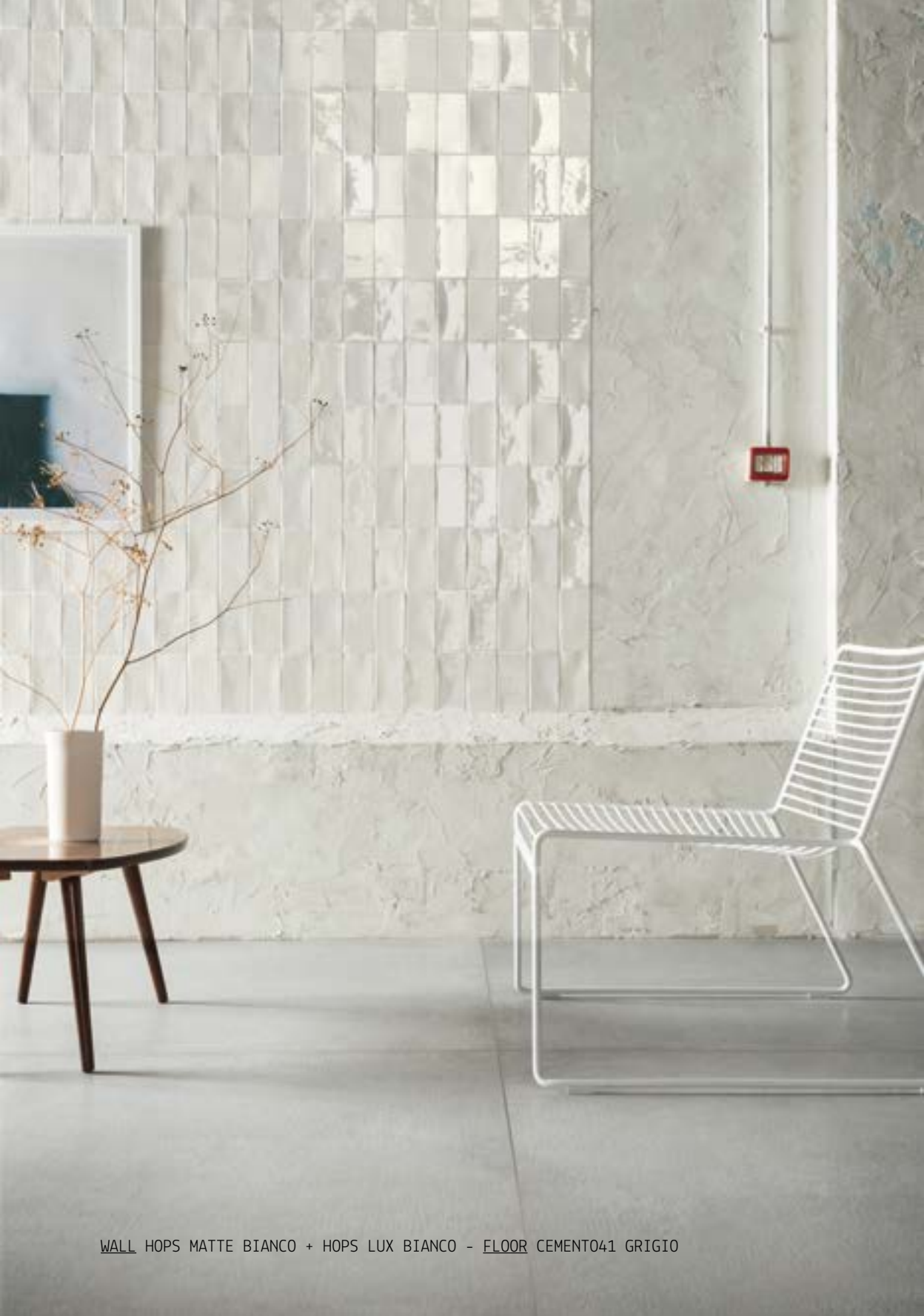
WALL HOPS MATTE BIANCO + HOPS LUX BIANCO - FLOOR CEMENT041 GRIGIO